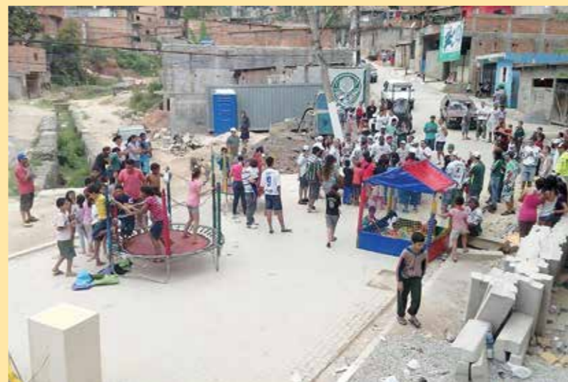
Ação Dia das Crianças - Entrega de Brinquedos - Diadema-SP

mas não menos importante, o Dia de Ação do Bem. Infelizmente ainda não há um número exato, mas como exemplo, na campanha de páscoa de 2018, entre os membros da Capital Paulista e nas subdeses espalhadas no país, foram mais de 4 mil pessoas beneficiadas (fotos).