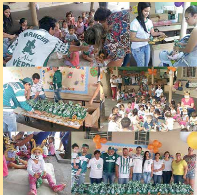
Ação de Páscoa - Dracena-SP

Há 35 anos, a Mancha Verde iniciava uma história, que como muitas organizações ou grupos sociais, vivenciaram momentos tristes mas também momentos de muitas glórias. Foi em 11 de janeiro de 1983 que três grupos de torcedores (Império Verde, Inferno Verde e Grêmio Alviverde) juntaram forças e deram o ponta