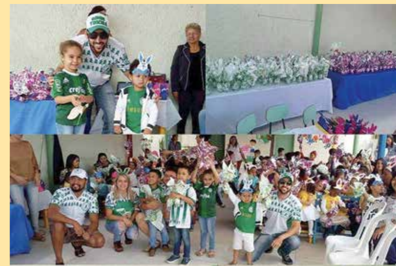
Ação de Páscoa - Vitória da Conquista-BA

mas não menos importante, o Dia de Ação do Bem. Infelizmente ainda não há um número exato, mas como exemplo, na campanha de páscoa de 2018, entre os membros da Capital Paulista e nas subdeses espalhadas no país, foram mais de 4 mil pessoas beneficiadas (fotos).