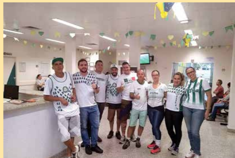
Ação Doação de Sangue - São José do Rio Preto-SP

A violência no futebol não é um fenômeno intrínseco ao esporte,