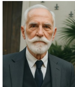
Ernesto Bozzano por IA

Suas conclusões foram categóricas: os processos de desprendimento da consciência do