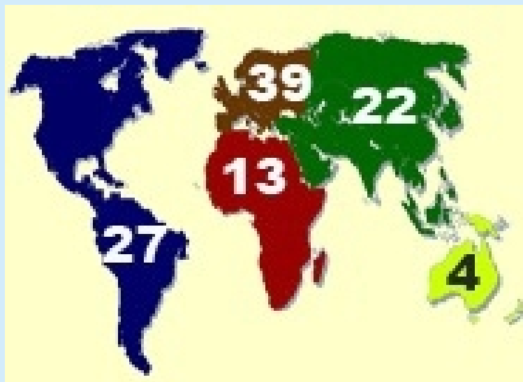
Mapa-múndi com os números alcançados pela revista do, pois, a edição número 204, a revista publicou:

Eis os números registrados de 18 de abril de 2007 a 31 de março de 2011, nos quais não estão os dados relativos à edição 203, que circulou na internet depois do levantamento feito, ou seja, no dia 2 de abril: