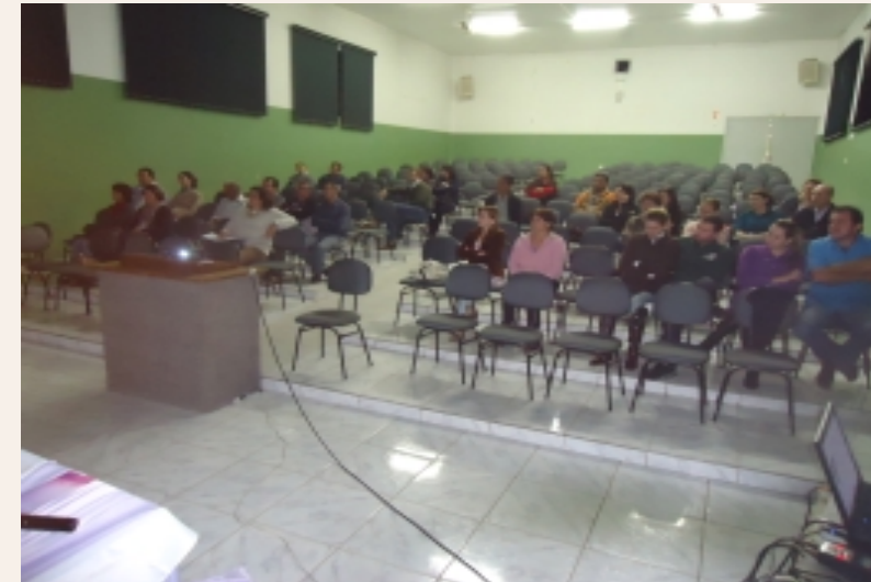
Público presente no seminário sobre Mediunidade

tomado o SERESP (seminário regional espírita, onde o palestrante expõe tema da URE com abertura de perguntas para o público acadêmico); também a retomada da feira regional do livro espírita em local público, agendada para maio próximo, em Guarapuava. Para as demais cidades serão definidos os locais.