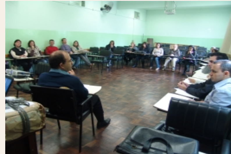
Participantes da área de Estudo da Doutrina

Surgimento de uma Casa Espírita em Guarapuava, comissão criada para elaboração de projeto COMO CONSTRUIR UMA CASA ESPÍRITA, com ajuda da FEP; também será realizada neste ano a CEME (Confraternização de Mocidade Espírita). Então, são muitas atividades que visam, sobretudo, à congregação da família espírita em torno de objetivos comuns.