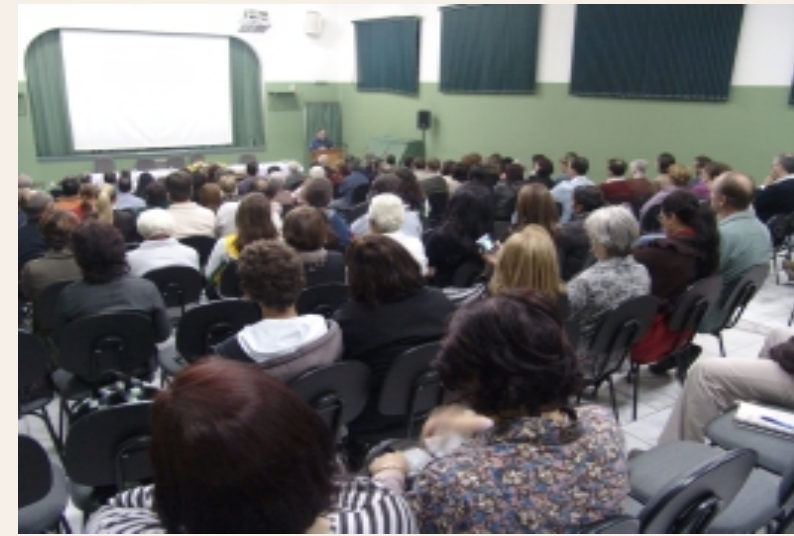
Trabalhadores e dirigentes reunidos

Destacou que todas essas atividades serão revitalizadas com o apoio da FEP, o que permitiu um engajamento dos trabalhadores e resultados surpreendentes: todas as Casas Espíritas trabalhando na feira. Um outro projeto, que é uma grande novidade, é o